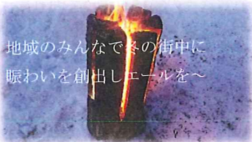
地域みんなで冬の街中に 賑わいを創出しエールを〜