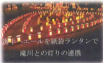
選手へエールを紙袋ランタンで 滝川との灯りの連携