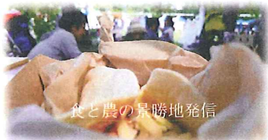
食と農の景勝地発信