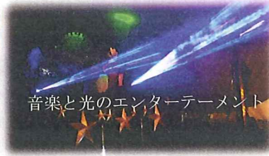
音楽と光のエンターテインメント